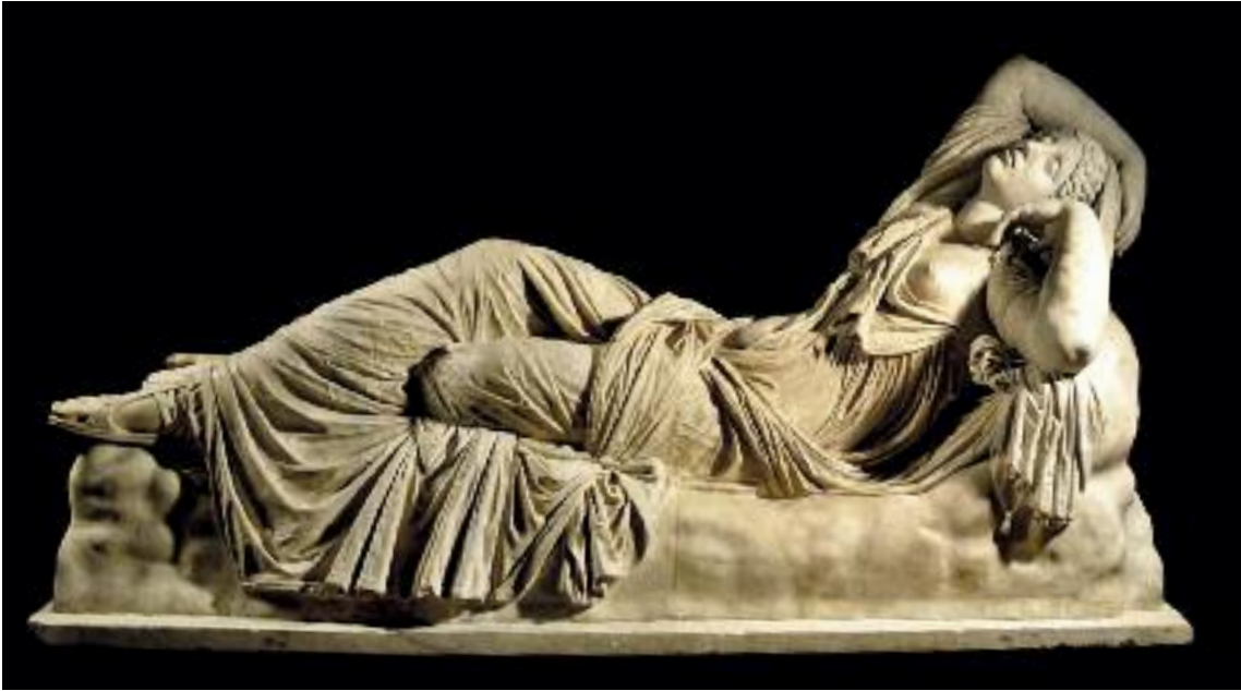
Arte romana del II secolo d.C.,

La maggior parte dei visitatori, che prima s’affollavano davanti alla Sacra famiglia di Michelangelo, si doveva arrabattare per vederne brani sparsi, incuneando lo sguardo in una selva di teste. Il che poteva andar bene per i molti (purtroppo) che agli Uffizi ven- gono solo per un rito ineluttabile, ma non certo per coloro che nei dipinti ravvisano un luogo dell’anima. Nella nuova sala – anch’essa natural- mente rossa, essendo dedicata al XVI secolo, nei suoi esordi fulgidi – il Tondo Doni occupa il centro della