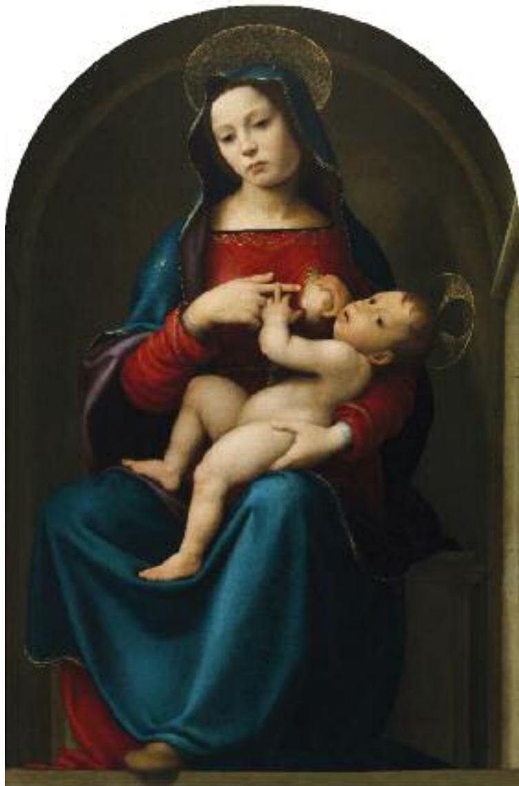
Giuliano Bugiardini, Madonna col Bambino