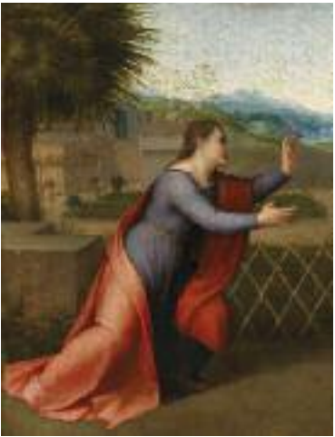
Andrea del Sarto, Noli me tangere, particolare