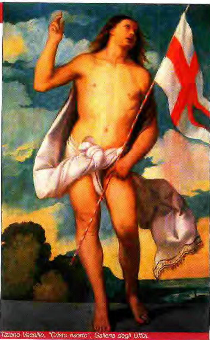
Tiziano Vecellio, "Cristo risorto", Galleria degli Uffizi.

Sì, bravo Raffaello, bravissimo Michelangelo "...ma xe Tician che ten la bandera!....".