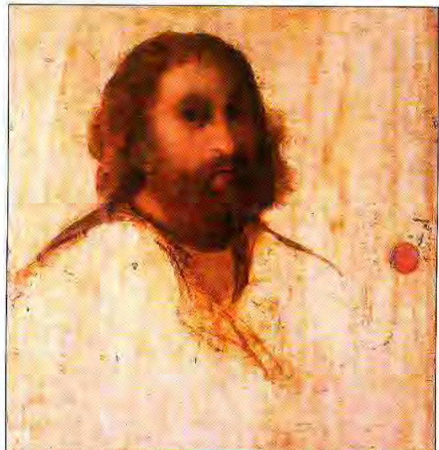
Jacopo Palma il Vecchio, "Doppio ritratto" (verso), Galleria degli Uffizi.

Due miliardi per due capi della pittura veneziana del grande secolo. Se si pensa che nello stesso anno 2001 il Ministero acconsentiva ad acquistare in asta Finarte per due miliardi e mezzo la "Santa Monaca" di Paolo Uccello ora esposta accanto alla "Battaglia di San Romano" e anch'essa di provenienza Contini Bonacossi, bisogna riconoscere che l'Amministrazione ha avuto per Firenze e per gli Uffizi una attenzione oggettivamente speciale.