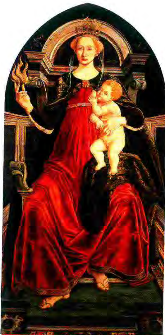
Piero del Pollaiuolo, "Allegoria della Carità". A destra, disegno preparatorio sul verso del dipinto.