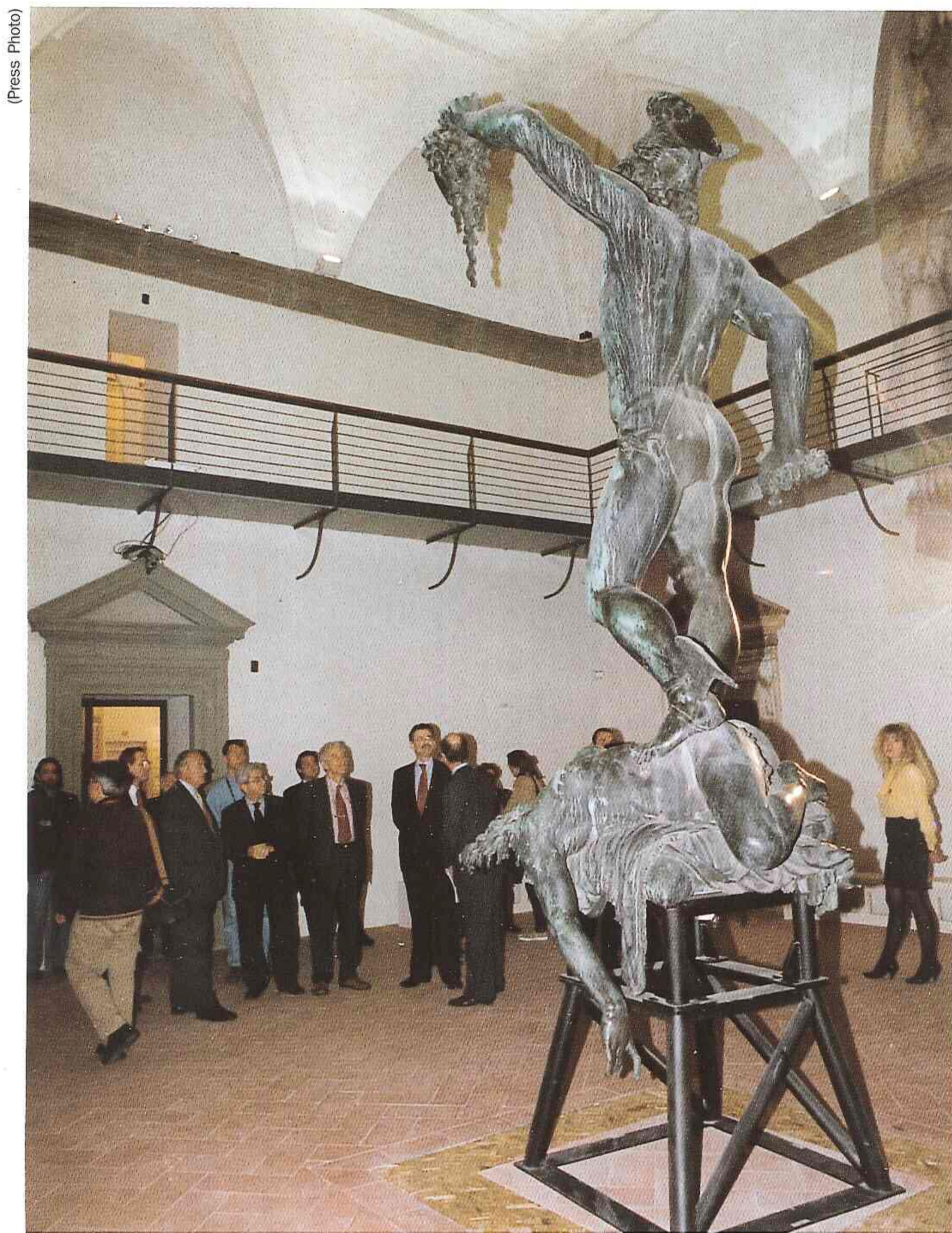
La sala degli Uffizi dove sarà eseguito il restauro del Perseo e, in alto, la lapide di via della Pergola che ne ricorda la complessa fusione.