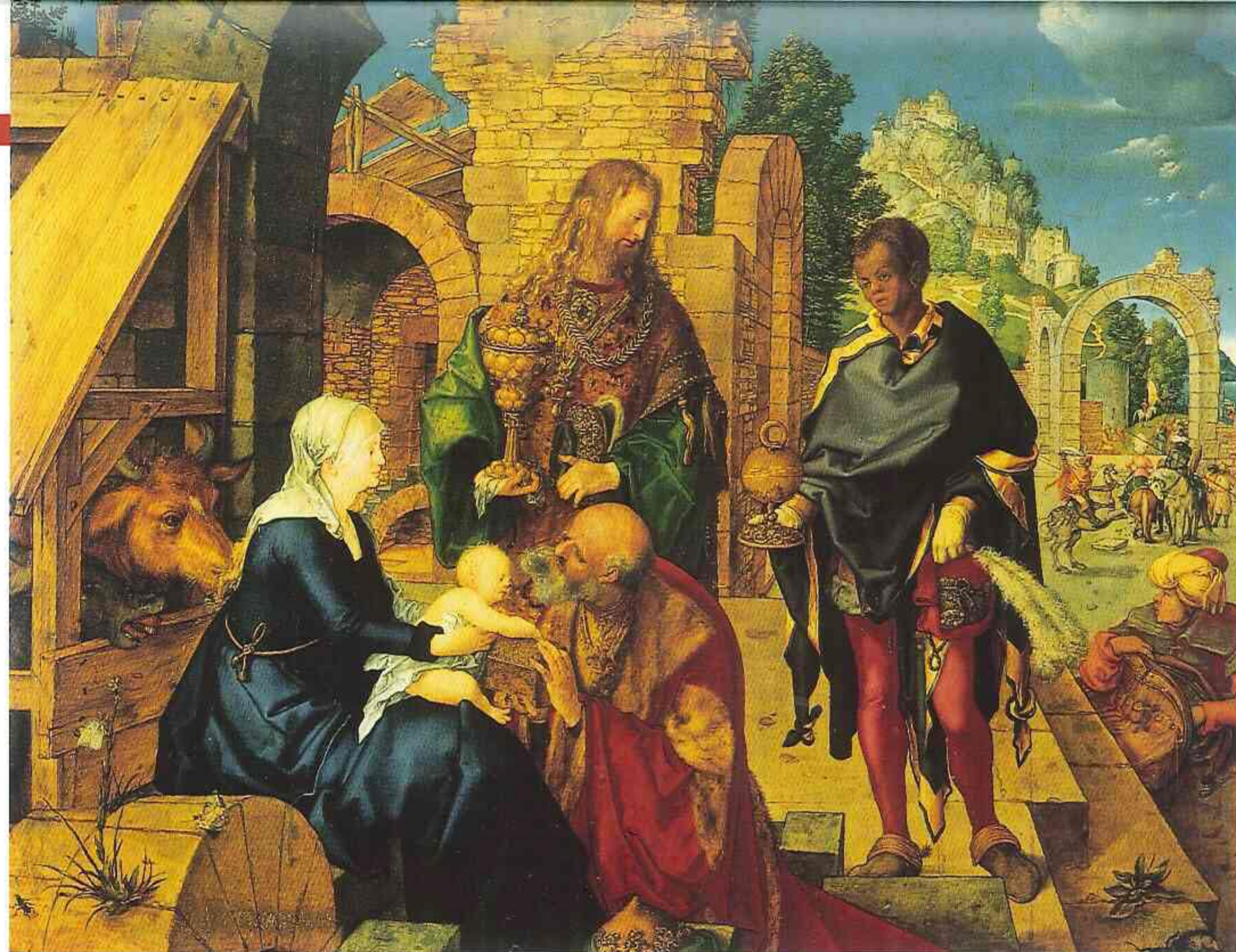
Albrecht Dürer, "Adorazione dei Magi".

Comunque di meraviglie si continuò a raccogliere, e quali, grazie a direttori e 'antiquari' uno più eccezionale dell'altro: dai nominati Pelli e Lanzi, all'eroico Puccini che osò sfidare - si può ben dire - Napoleone, caricando 73 casse piene di opere d'arte su una nave, nell'anno della travolgente vittoria di Marengo (1800), e salpando con esse per Palermo, ben protette dalla vigilanza inglese, per sottrarle alle cupidigie francesi. Non è possibile in questa sede elencare le numerosissime acquisizioni del periodo lorenesse. Diremo in generale che oltre agli acquisti dettati da una logica 'illuminata' e già storicistica, secondo cui conviene "completare le serie degli autori, anziché moltiplicare le opere loro" (Puccini), si mise a