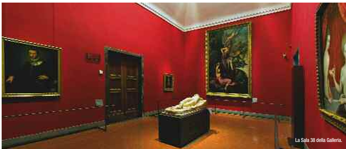
La Sala 38 della Galleria.

Una selezione di opere ispirata alla cultura del granduca Medici conferisce una particolare atmosfera alla rinnovata Sala 38. Il nuovo allestimento è avvenuto con il sostegno degli Amici