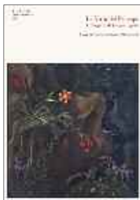
La copertina del volume dedicato all' Allegoria di Jacopo Ligozzi.

di opere ispirata alla cultura di Francesco, alla cui disinvolture intellettuale si attaglia l'ambiguità d'una scultura che nel clima cortigiano europeo avrebbe incontrato grande fortuna. Il giovane efebico è languidamente sdraiato su un piano al centro della sala tra l'effigie di Francesco e la tavola dirimpetto che esemplifica la sensibilità raf-