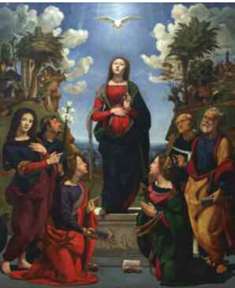
Piero di Cosimo, Incarnazione di Cristo , Galleria degli Uffizi.

mus e Gretchen Hirschauer ha un'impostazione monografica, per far scoprire al pubblico nord-americano il profilo di questo grande maestro del Rinascimento.