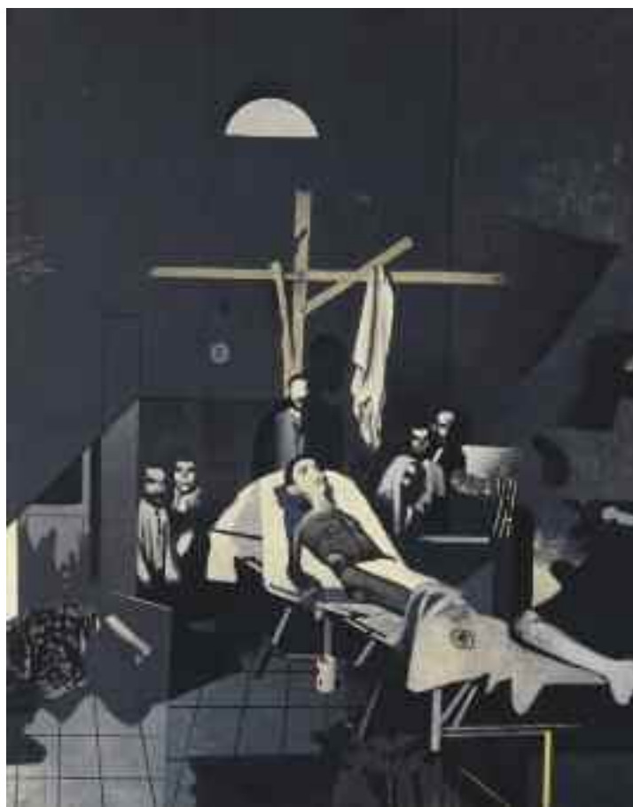
Gianfranco Ferroni, Senza resurrezione , 1968.